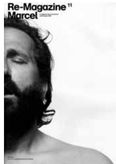
Re-Magazine door Jop van Bennekom

de opleiding hebben gedrukt. Zij vertegenwoordigen beide genoemde opvattingen, maar wat ze verenigt is de nadruk op typografie en het typografische detail. Mensen verbinden die nadruk aan de Werkplaats Typografie. Wij vonden het leuk om daar bij de uitnodiging van deze tentoonstelling een beetje de draak mee te steken en een cliché te maken van alles waar die Arnhemse stijl tussen aanhalingstekens voor staat: nuchterheid, eenvoud, uithangende cijfers.